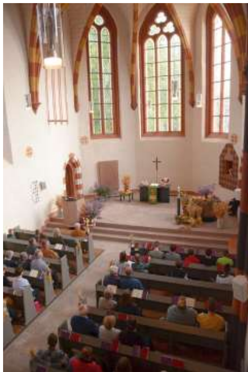
Erntedankfest in der Rüdigheimer Kirche