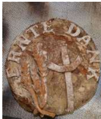
Brotebacken für das Erntedankfest