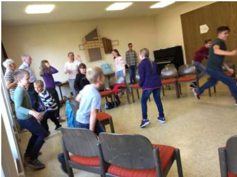
Auch Action fehlt nicht beim Kinderbibeltag